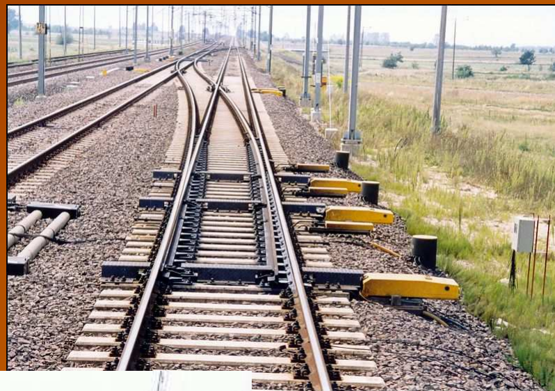
Centralna Magistrala Kolejowa