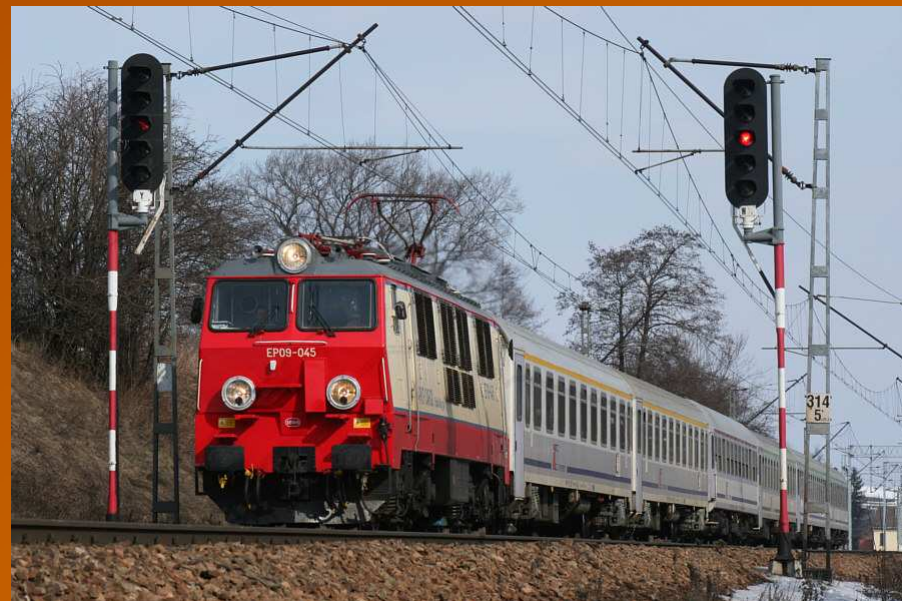
Centralna Magistrala Kolejowa