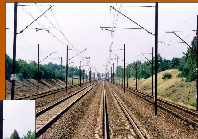
Jastrzębski (sierpień 2002)