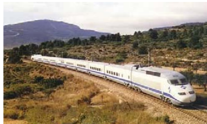
K612Y2VT - 2009/2010