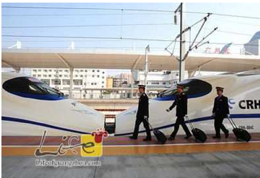
CHR3 Obr 2 [3]

Na trati Wuhan - Guangzhou jsou v provozu vlaky CRH2C and CRH3C (China Railway High-speed, první souprava navržená a vyrobená v Číně, ve spolupráci s firmou Siemens Velaro, jednotky vyrobila firma Sifang Locomotive and Rolling Stock Company). Vlaky (CRH2) jsou založeny na technologii vyvinuté společností Kawasaki a upraveny tak, aby vyhovovaly standardům Čínské železnice. Vlaky použité na trati jsou vyráběny v Číně. Průměrná rychlost je 313 km/h. To je nejrychlejší vlaková doprava s použitím CRH2C a CRH3C vlaků. Vlaky mají maximální provozní rychlost 350 km/h. Každý vlak se skládá ze dvou osmi vozových elektrických jednotek spojených dohromady. To znamená 16ti vozový vlak. Kapacita pro přepravu cestujících je asi 1114 osob pro jednotku (CRH3C × 2) resp. 1220 (CRH2C × 2).