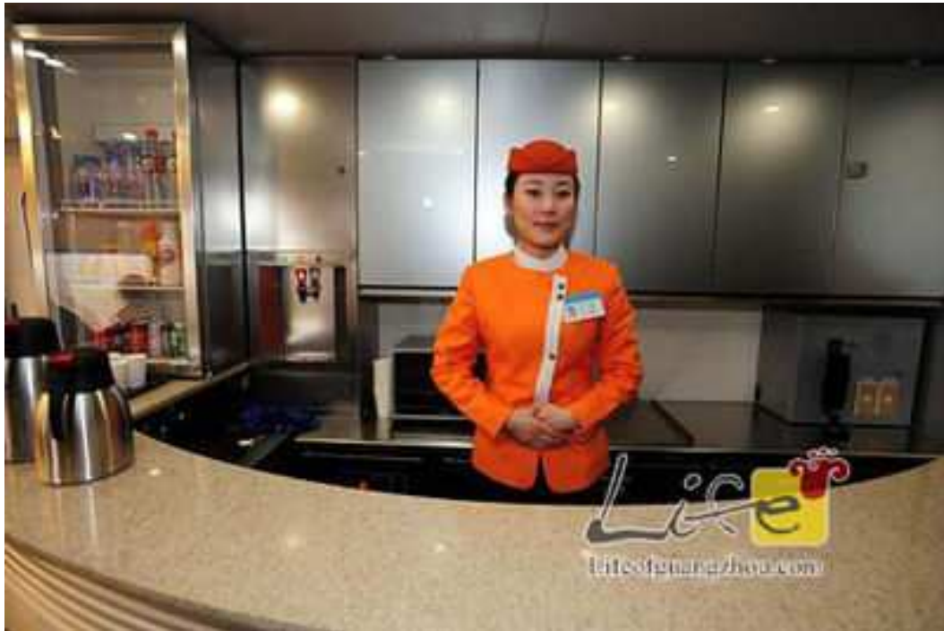
Občerstvení ve voze Obr 5 [3]

Během prvních 56 dnů v roce 2010, bylo přepraveno 1,108 milionu lidí, což je 43 tisíc za den. Celkové příjmy z prodaných lístků byly asi 700 milionů jenů, méně než se očekávalo. Od 3.3.2010 byly přidány na trasu další vlaky. Od 1. července 2010, byly spojené vlaky nahrazeny jednotlivými a frekvence byly zdvojnásobeny. Dva non-stop vlaky s jízdou 03h08m mezi Wuhan a Guangzhou jih byly nahrazeny šesti spoji s jízdou 03h16m a jednou zastávkou v Changsha jih.