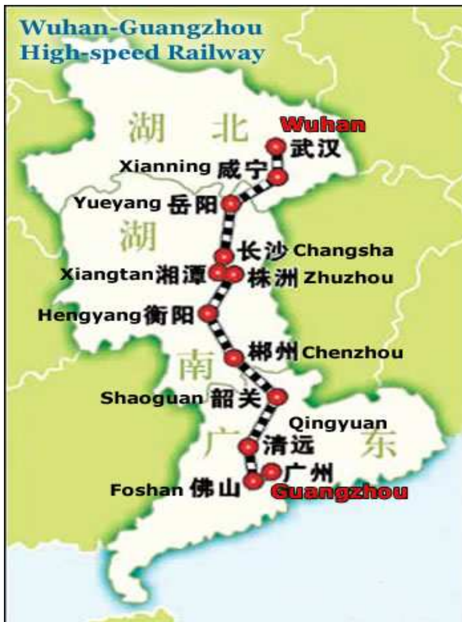
Mapa Wuhan – Guangzhou Obr 1 [2]

Trať se nachází v jižní části koridoru Peking - Guangzhou a je částí z plánovaného 2100 km dlouhého spojení, úsek Šanghaj - Wuhan je stále ve výstavbě, plánované otevření je v roce 2012.